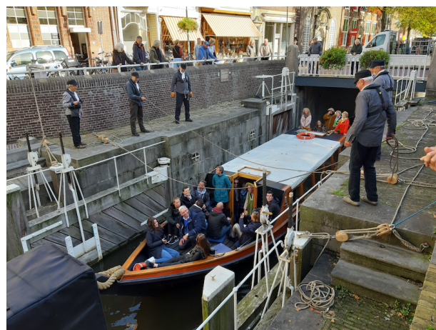
Demonstratie van de Donkere Sluis en doorgang Jan Salie op Zotte Zaterdag.

Den Onthaestingh ten slotte blijft liggen waar ze ligt en bereidt zich voor op haar nieuwe bijbaan als boat & breakfast.